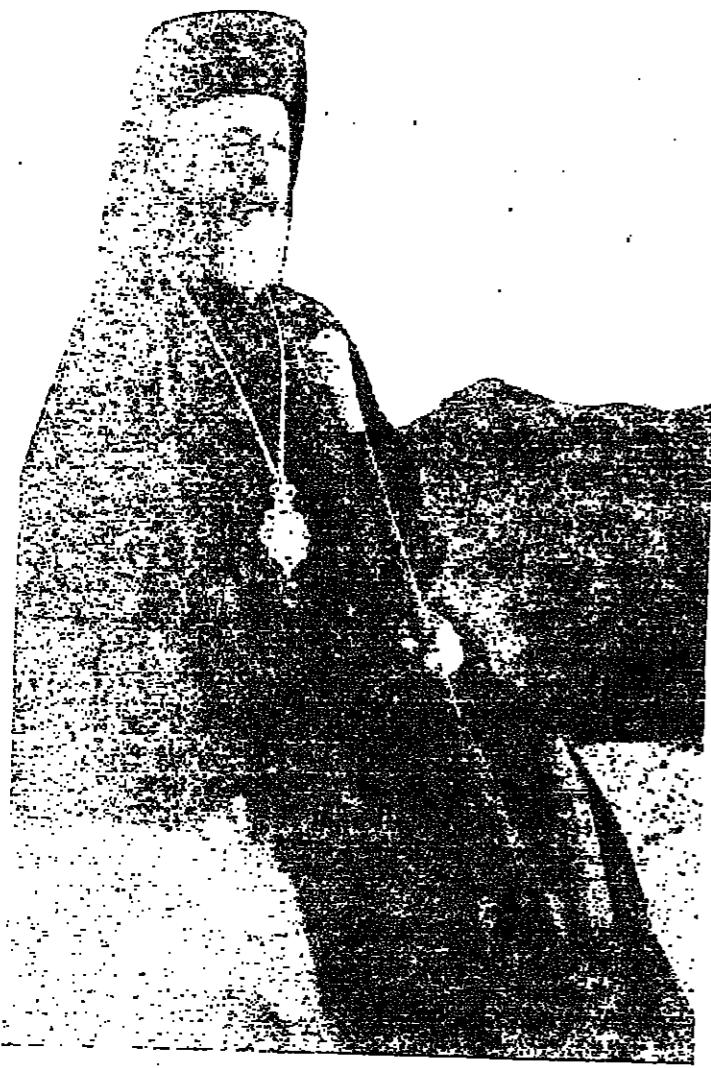
مكاريوس في جبال قبرص